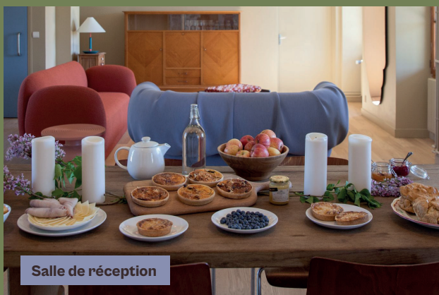
Salle de réception