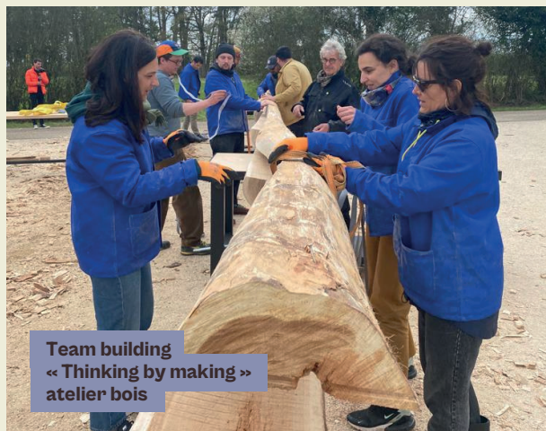
Team building « Thinking by making » atelier bois