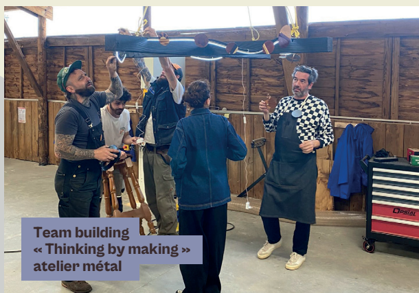
Team building « Thinking by making » atelier métal