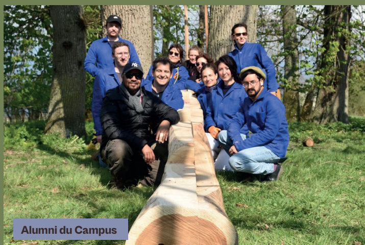
Alumni du Campus

Ancré au cœur de la nature, le Campus a un réel engagement de développement durable , il met en avant les matériaux biosourcés et les ressources renouvelables, favorisant ainsi l'économie circulaire.