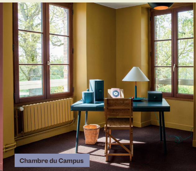
Chambre du Campus