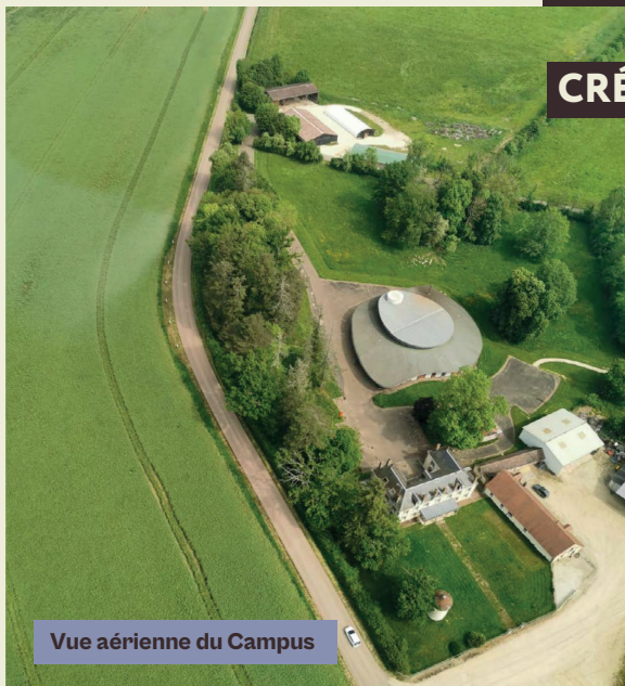
Vue aérienne du Campus