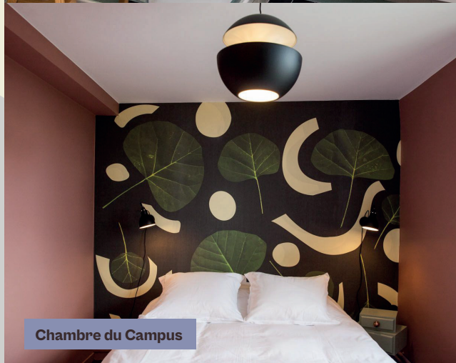
Chambre du Campus