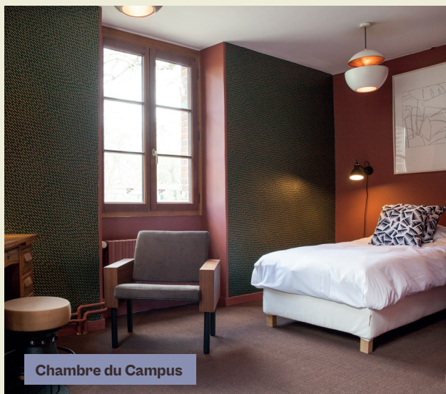
Chambre du Campus