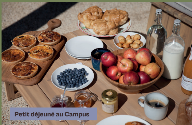
Petit déjeuner au Campus

Une cheffe pour la résidence avec du sourcing local et des rencontres avec des vignerons Bourguignons .