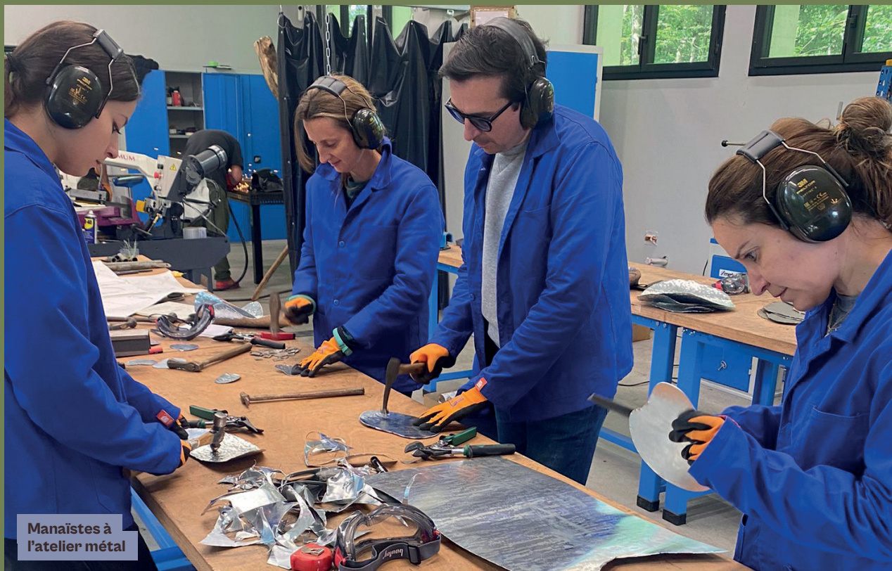
Manâistes à l'atelier métal