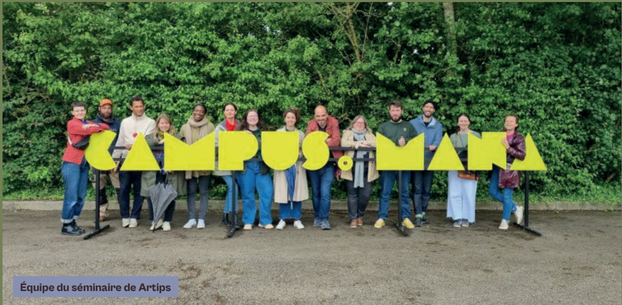
Équipe du séminaire de Artips