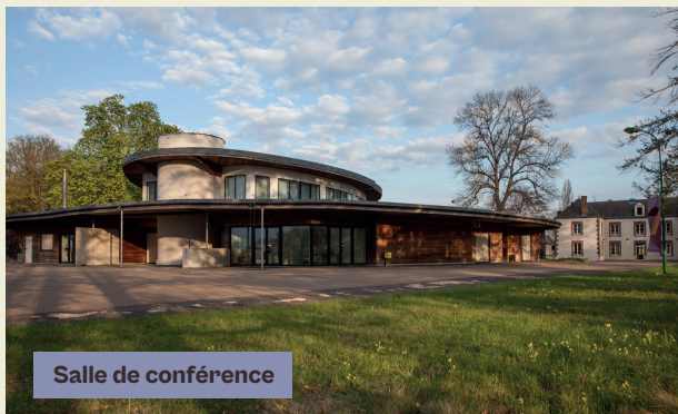
Salle de conférence