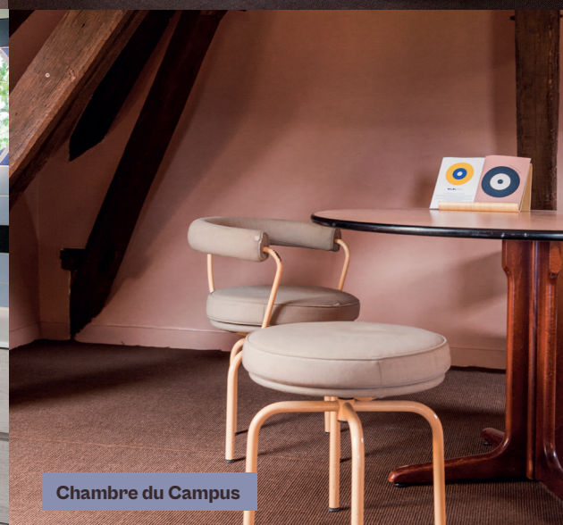
Chambre du Campus