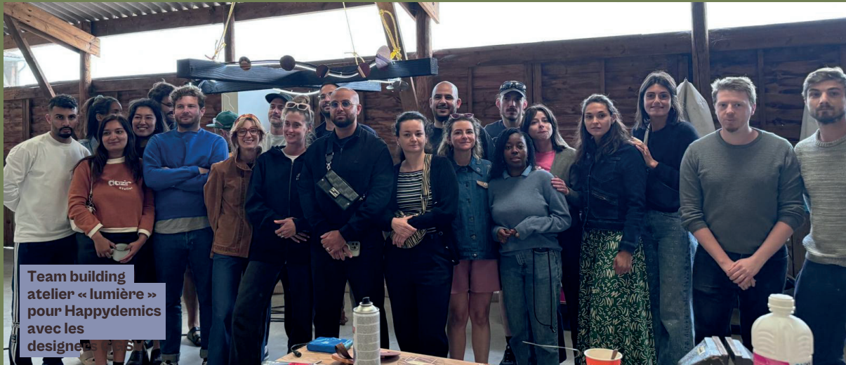
Team building atelier « lumière » pour Happydemics avec les designers