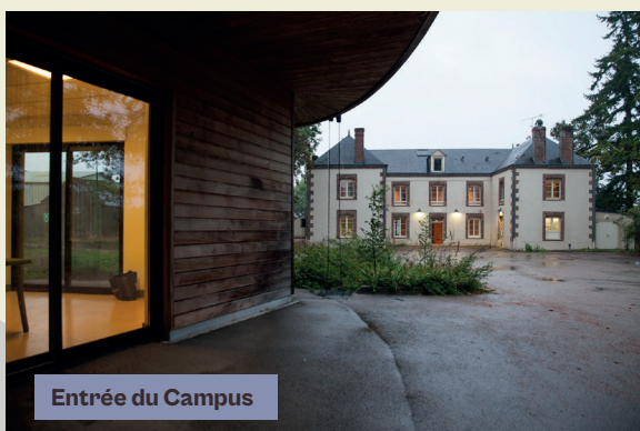
Entrée du Campus

Nous proposons des formations d'initiations, des séminaires « Thinking by Making » : (réfléchir en construisant ensemble), avec des ateliers dans les métiers d'arts, le design, l'architecture et l'innovation.