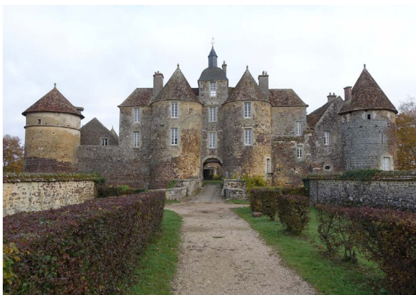
Château de Ratilly - Treigny