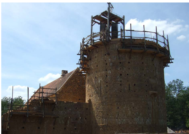
Château de Guédelon - Treigny