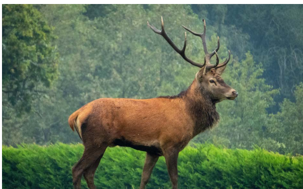
Parc Animalier de Boutissaint - Treigny