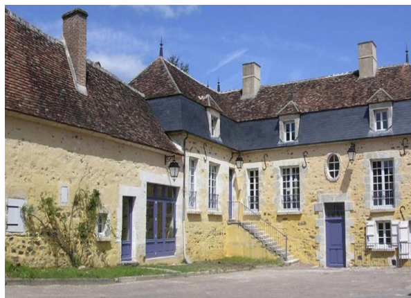
Le couvent de treigny