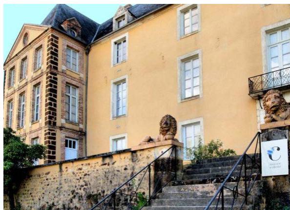
Musée Colette - Saint-Sauveur-en-Puisaye