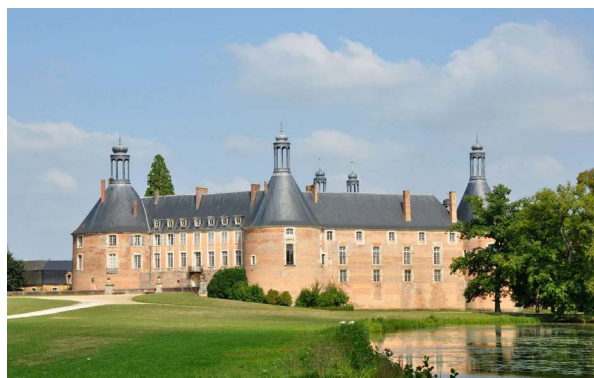
Château de Saint Fargeau - Saint Fargeau